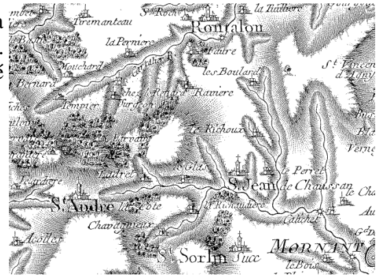
Carte de Cassini aux environs de St André la Côte

Cassini de Thury va établir sur le sommet de St-André-la-Côte (934m) un point d'observation pour établir par triangulation la première carte de Lyon entre 1758 et 1761. Le lieu appelé « Plat du foin » dénommé ensuite « Haut du Brun » est devenu « Signal » car dans le langage des cartographes, un signal est un système placé sur une borne (encore visible à St André) qui permet de repérer un point de visée de leurs appareils.